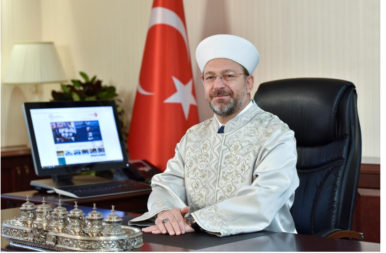
Prof. Dr. Ali ERBAŞ Diyanet İşleri Başkanı